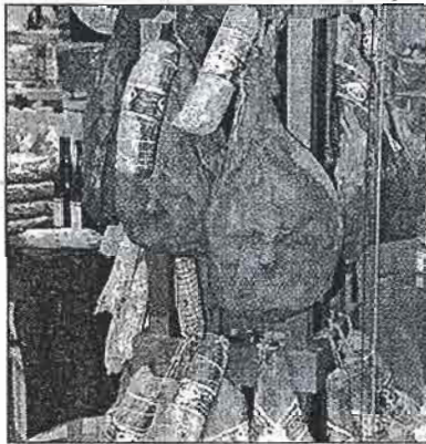
Schinken satt: Die echte italienische Küche ist die der einfachen Leute.

Das die italienische Lebensart einiges zu bieten hat ist nichts Neues. Mit der „Mondo Italia“ findet aber erstmals in Deutschland eine Messe statt, die das Land in seiner ganzen Vielfalt präsentiert. Besucher können komplett ins Dolce Vita abtauchen und sich über die neuesten italienischen Kreationen aus den unterschiedlichen Branchen informieren. Mode, Schmuck, Design sowie Kunst und Kultur vermitteln einen lebhaften Eindruck vom legendären italienischen Lifestyle. Und selbstredend wird auch der kulinarische Aspekt nicht unter den Teppich gekehrt – ganz im Gegenteil. In Halle 5.0 präsentieren sich die 20 Regionen Italiens plus San Marino mit all ihren kulinarischen Spezialitäten.